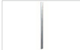
Flachstab 20 x 3 mm zum Einstecken in Halterung mit Stecklasche Länge 400 mm Bestell-Nr.: GL 1500 850 040 Länge 600 mm Bestell-Nr.: GL 1500 850 060 Länge 800 mm Bestell-Nr.: GL 1500 850 080 Länge 1000 mm Bestell-Nr.: GL 1500 850 100