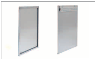
Halterung einseitig mit Anstecklasche 3 mm zum Anstecken an CC-Wagen für Bilder DIN A5 Hochformat 215 x 150 mm Bestell-Nr.: GL 1500 812 0/3 für Lamine A5 Hochformat 218 x 155 mm Bestell-Nr.: GL 1500 812 0/3L für Bilder DIN A4 Hochformat 297 x 210 mm Bestell-Nr.: GL 1500 082 2/3 für Lamine A4 Hochformat 305 x 217 mm Bestell-Nr.: GL 1500 082 2/3L (Halterung einseitig mit Anstecklasche 10 mm, 15 mm oder 20 mm auf Anfrage)