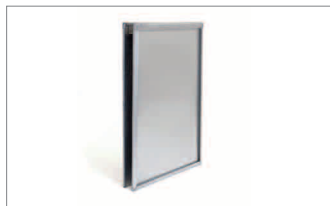
Halterung beidseitig mit U zum Überhängen auf Rohr 15 mm (ohne Stecklasche) für Bilder DIN A5 Hochformat 215 x 150 mm Bestell-Nr.: GL 1500 813 /20 für Lamine A5 Hochformat 218 x 155 mm Bestell-Nr.: GL 1500 813 20L für Bilder DIN A4 Hochformat 297 x 210 mm Bestell-Nr.: GL 1500 823 /20 für Lamine A4 Hochformat 305 x 217 mm Bestell-Nr.: GL 1500 823 20L