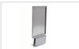
Halterung zum Aufstecken auf Kunststoffkisten (U-Stück 15 mm) für Bilder DIN A5 Hochformat 215 x 150 mm Bestell-Nr.: GL 1500 008 116 für Lamine A5 Hochformat 218 x 155 mm Bestell-Nr.: GL 1500 081 16L für Bilder DIN A4 Hochformat 297 x 210 mm Bestell-Nr.: GL 1500 008 216 für Lamine A4 Hochformat 305 x 217 mm Bestell-Nr.: GL 1500 082 16L