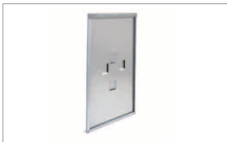
Halterung einseitig mit Kreuzstecklasche für Flachstab für Bilder DIN A5 Hoch-/Querformat 215 x 150 mm Bestell-Nr.: GL 1500 008 100 für Lamine A5 Hoch-/Querformat 218 x 155 mm Bestell-Nr.: GL 1500 081 00L