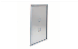
Halterung einseitig mit Stecklasche für Flachstab für Bilder DIN A4 Hochformat 297 x 210 mm Bestell-Nr.: GL 1500 000 820 für Lamine A4 Hochformat 305 x 217 mm Bestell-Nr.: GL 1500 082 00L